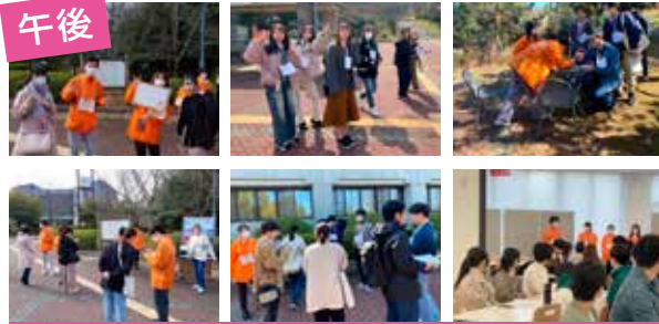
大教大探索ゲーム

たこ焼きでお腹がいっぱいになったら、いよいよメイン企画の始まりです!広い大学内を探索しながら、班で協力してゲームを攻略していきます!探索を続けると、レアなたこもんもゲットできるかも……?