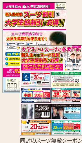
同封のスーツ無敵クーポン